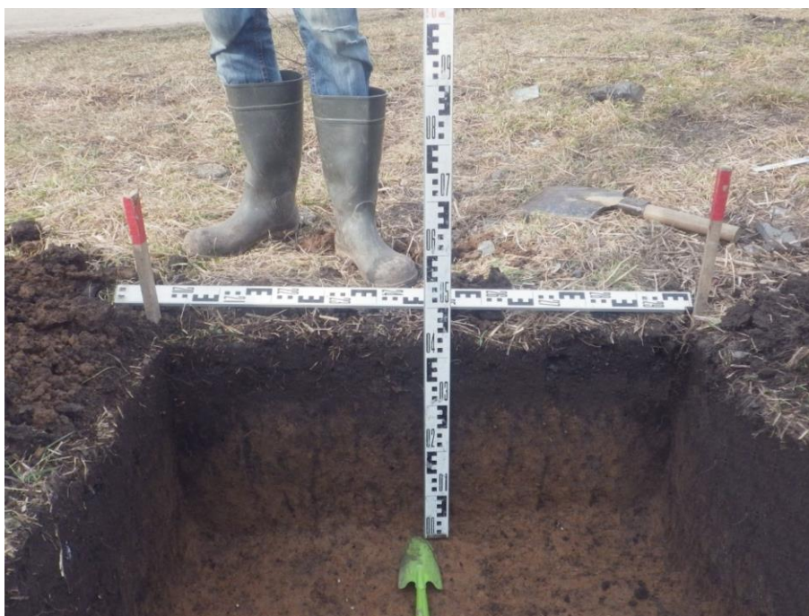
Ил.14. Нижегородская обл., Княгининский р-н, Ананьевский с/с, с. Егорьевское, ул. Осиновка, в 5 м на северо-запад от д. № 2. Шурф. Северный борт. Вид с юга.