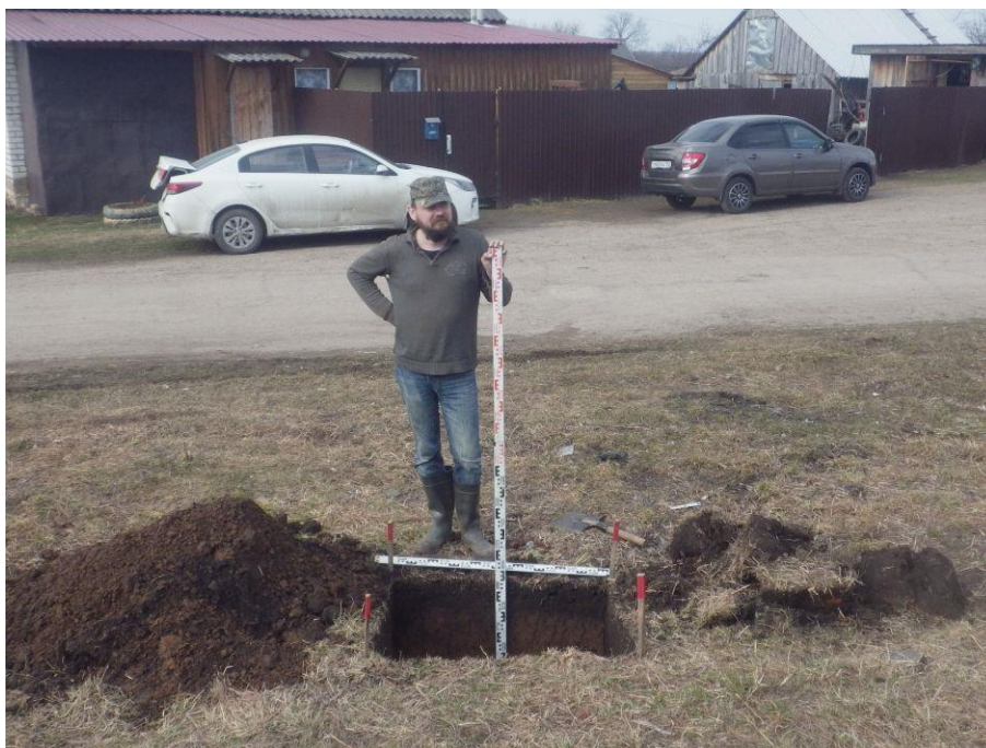
Ил.15. Нижегородская обл., Княгининский р-н, Ананьевский с/с, с. Егорьевское, ул. Осиновка, в 5 м на северо-запад от д. № 2. Шурф. Общий вид. Вид с юга.