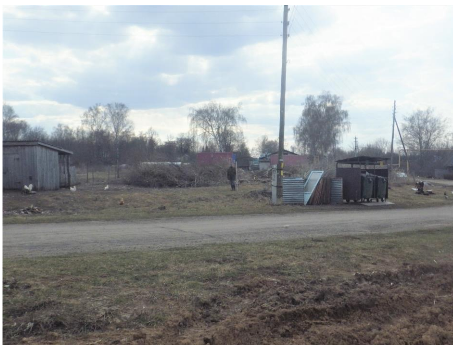
Ил.10. Нижегородская обл., Княгининский р-н, Ананьевский с/с, с. Егорьевское, ул. Осиновка, в 5 м на северо-запад от д. № 2. Точка фиксации 2. Общий вид участка обследования. Вид с востока-северо-востока.