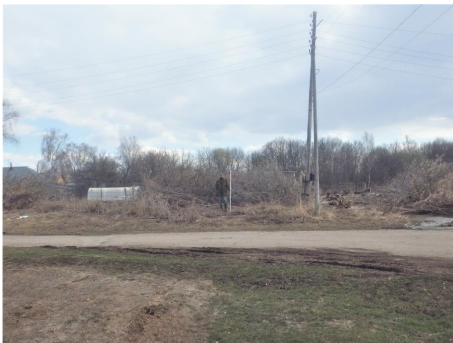
Ил.9. Нижегородская обл., Княгининский р-н, Ананьевский с/с, с. Егорьевское, ул. Осиновка, в 5 м на северо-запад от д. № 2. Точка фиксации 1. Общий вид участка обследования. Вид с северо-северо-запада.