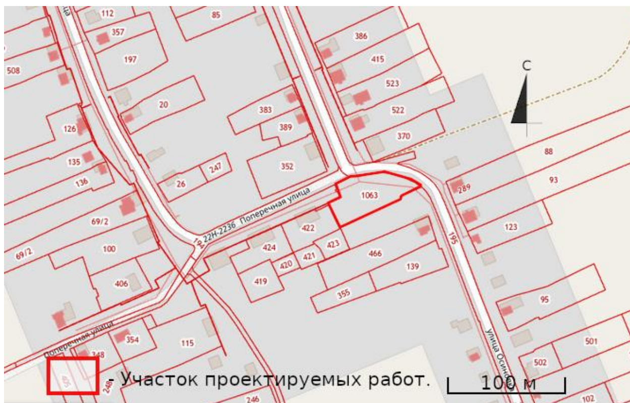
Ил.6. Нижегородская обл., Княгининский р-н, Ананьевский с/с, с. Егорьевское, ул. Осинка, в 5 м на северо-запад от д. № 2. Обозначение участка проектируемых работ на кадастровой карте. Источник: https://egrp365.org/map/?kadnum=52:30:0030009:1063 Дата обращения: 20.01.2023.