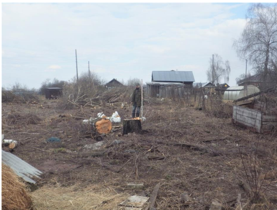
Ил.11. Нижегородская обл., Княгининский р-н, Ананьевский с/с, с. Егорьевское, ул. Осиновка, в 5 м на северо-запад от д. № 2. Точка фиксации 3. Юго-восточная часть участка обследования. Вид с запада-юго-запада.