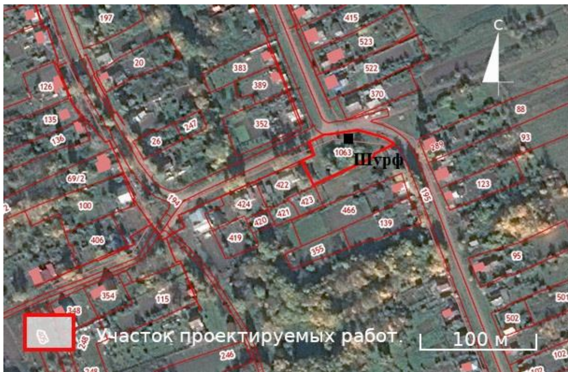
Ил.5. Нижегородская обл., Княгининский р-н, Ананьевский с/с, с. Егорьевское, ул. Осиновка, в 5 м на северо-запад от д. № 2. Обозначение участка обследования на спутниковой карте проектируемых работ 2013 г. Источник: https://egrp365.org/map/?kadnum=52:30:0030009:1063 Дата обращения: 20.01.2023.