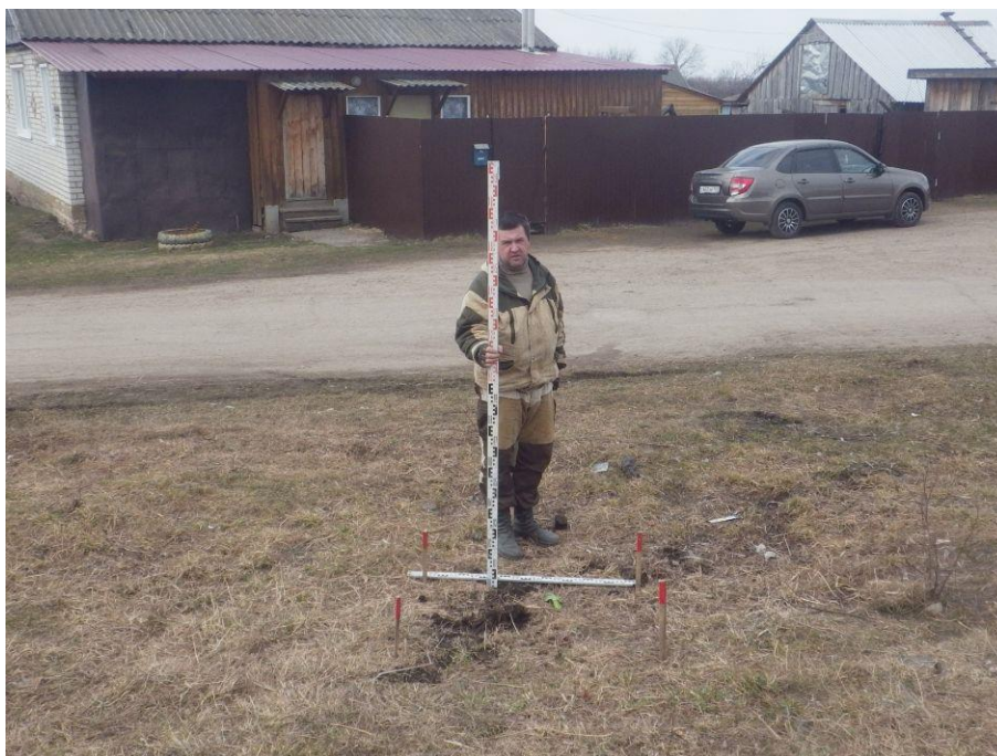
Ил.13. Нижегородская обл., Княгининский р-н, Ананьевский с/с, с. Егорьевское, ул. Осиновка, в 5 м на северо-запад от д. № 2. Место постановки шурфа. Вид с юга.