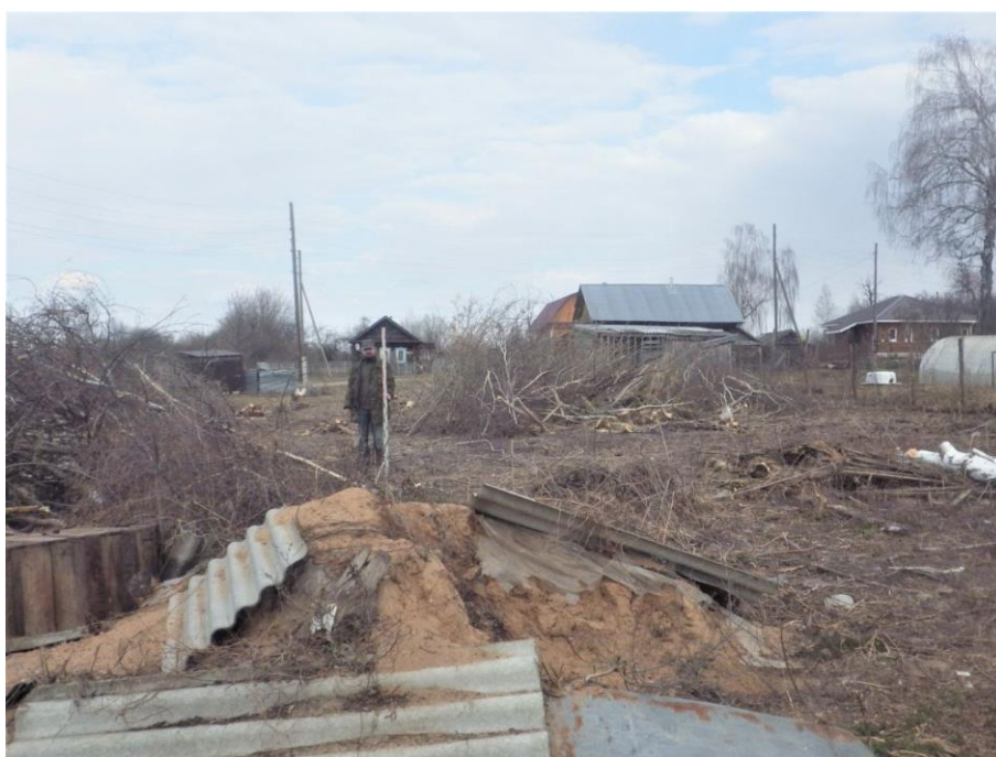
Ил.12. Нижегородская обл., Княгининский р-н, Ананьевский с/с, с. Егорьевское, ул. Осиновка, в 5 м на северо-запад от д. № 2. Точка фиксации 4. Центральная часть участка обследования. Вид с запада-юго-запада.