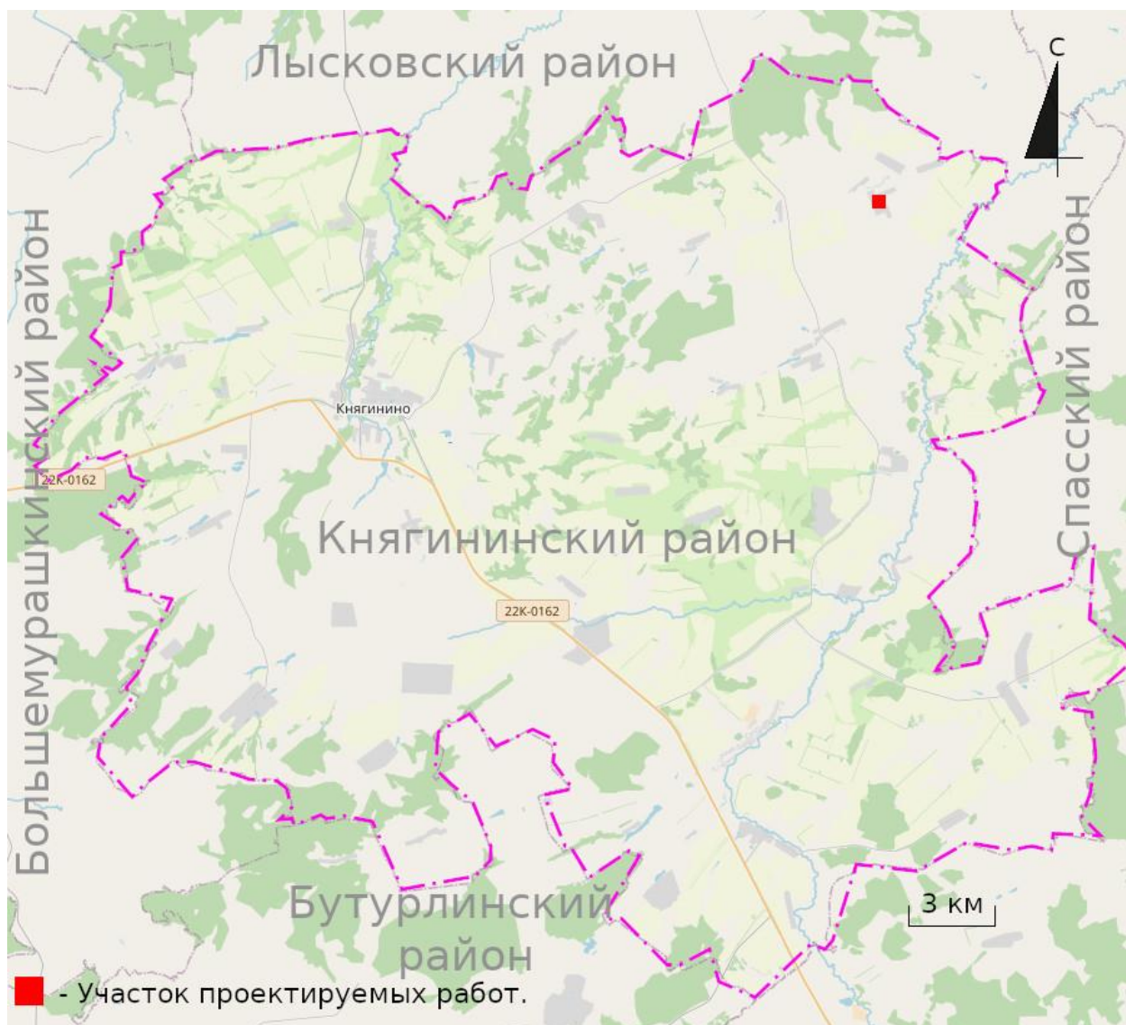
Ил.2. Нижегородская обл., Княгининский р-н, Ананьевский с/с, с. Егорьевское. Ситуационный план расположения участка проектируемого строительства.