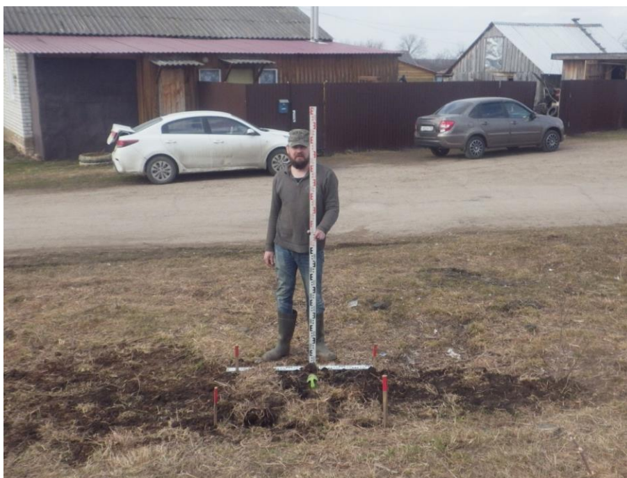
Ил.16. Нижегородская обл., Княгининский р-н, Ананьевский с/с, с. Егорьевское, ул. Осиновка, в 5 м на северо-запад от д. № 2. Закопанный