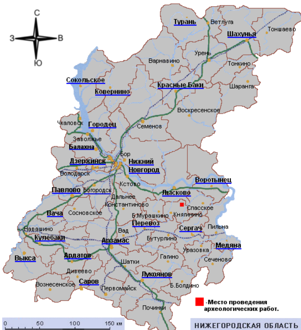
Ил.1. Карта Нижегородской области с указанием места проектируемых археологических работ в Княгининском районе с. Егорьевское.